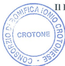
Tabella 1: Sezione Amministrazione Trasparente "Consorzio di Bonifica Ionio Crotonese"- (vedi tabelle allegate).